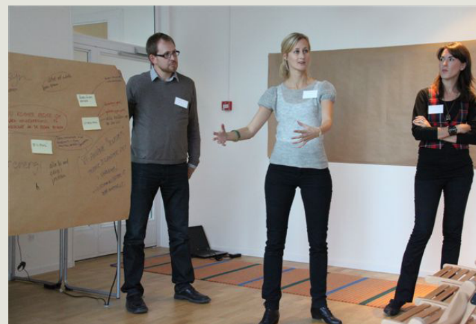
Workshopledare summerar resultatet