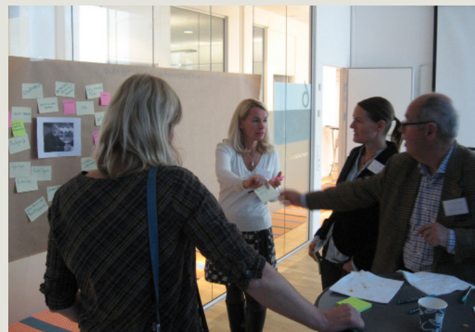
Diskussioner kring framgångsfaktorer i arbetsprocessen Nya Krokslätt