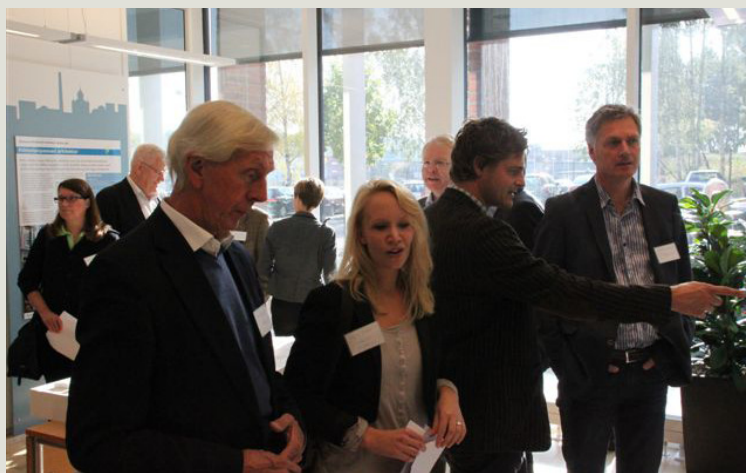
Deltagare diskuterar projektet Nya Krokslätt

Observera att texterna i sammanställningen är korrigerade och anpassade till imperfekt, inget material är dock borttaget.