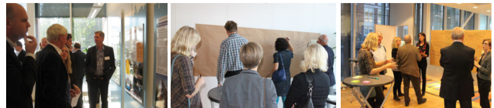
bilder från workshop på Nya Krokslätt